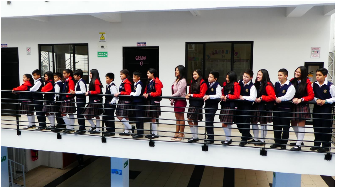
Die 6. Klasse zusammen mit der Klassenleiterin. Pasto September 2018