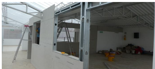
Die Bauarbeiten auf der Terrasse 07.01.2019