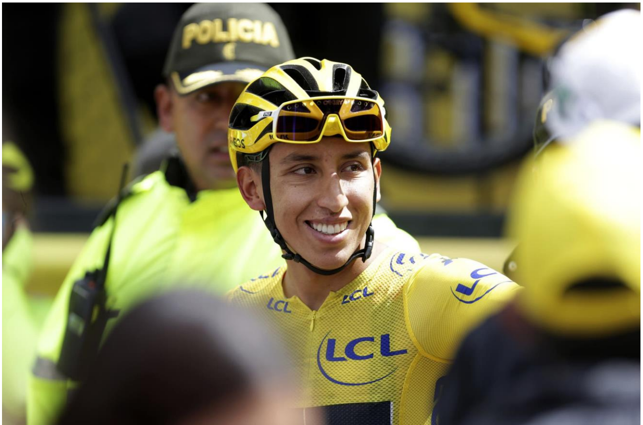
Der Kolumbianer Egan Bernal als Tour de France Sieger 2019