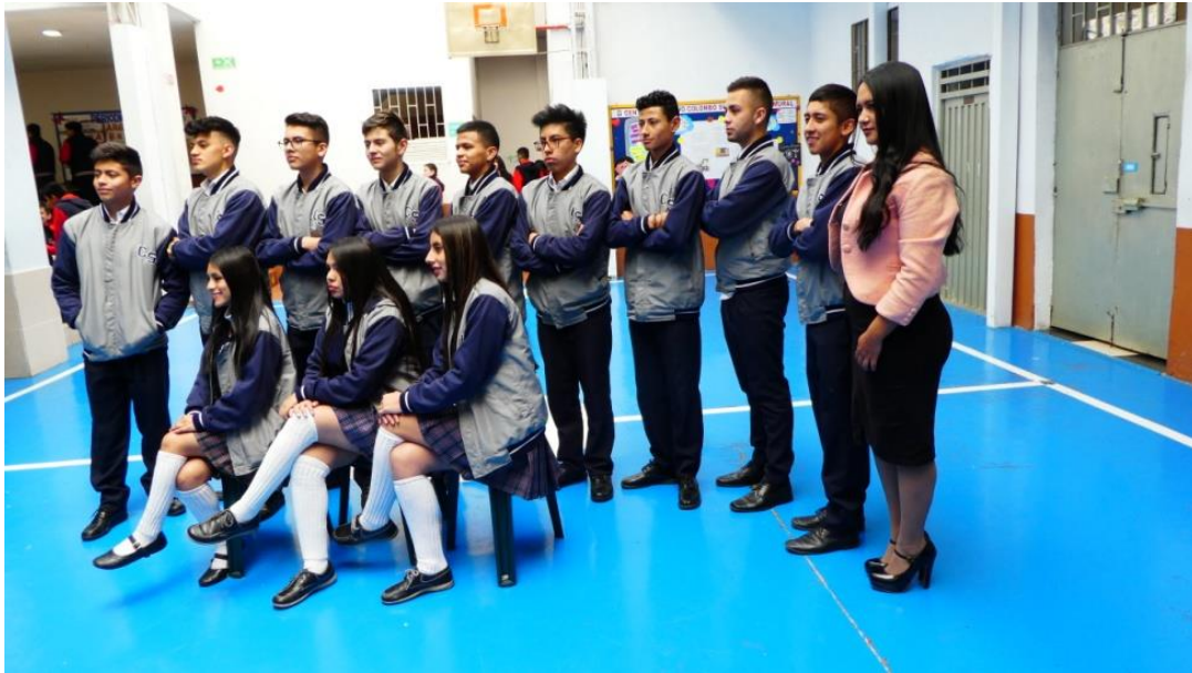
Die 11. Klasse zusammen mit der Klassenleiterin. 24. Oktober 2018