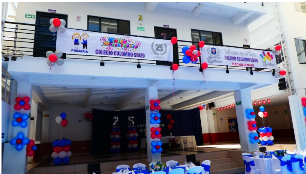
Der neue Trakt ist bereit für die Feier des 25. Jubiläums.

Die Eltern hatten am 13. Oktober einen kulturellen Abend organisiert, mit dem Zweck Geld zu sammeln, um es für etwas Nützliches für die Schule zu spenden. Ausserdem hat die Leitung der Schule eine Zeitschrift veröffentlicht, in der die Geschichte der Schule während diesen 25 Jahren zusammengefasst ist.