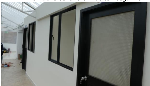
Die zwei Klassenzimmer auf der Terrasse.30.01.2019