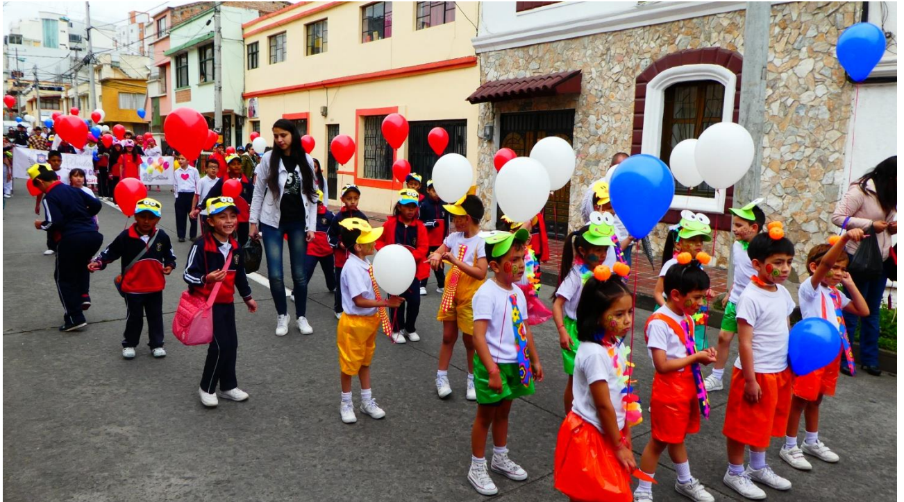
Kultureller Anlass zum 25. Jubiläum. Pasto, 13. Oktober 2018.