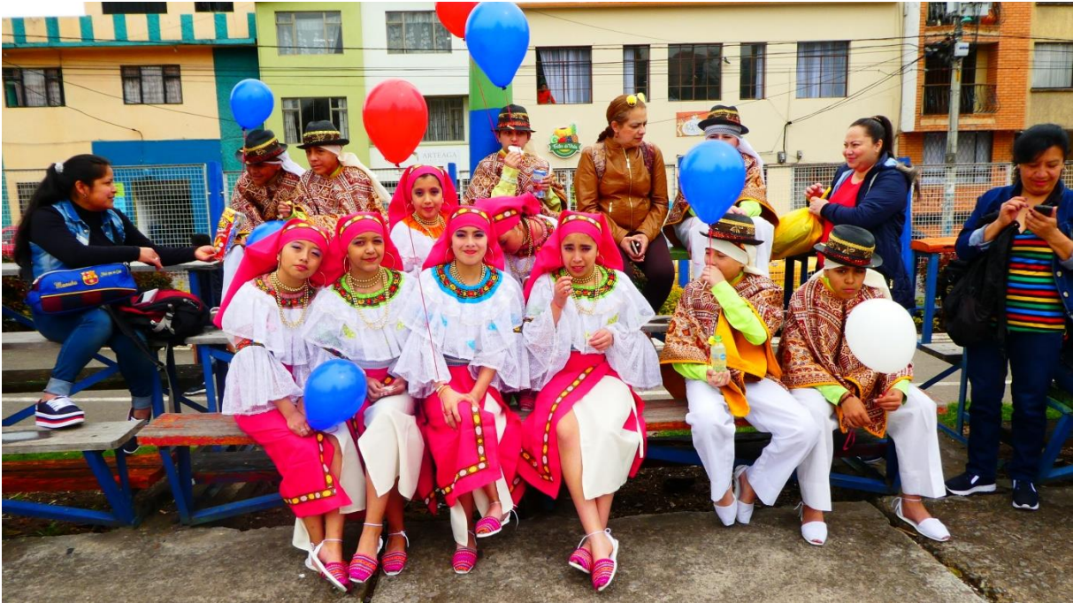
SchülerInnen der Schule „Colombo Suizo Pasto“ Kultureller Anlass zum 25. Jubiläum.