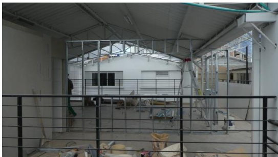
Die Fläche bevor die Arbeiten begannen