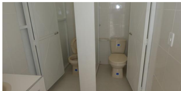
Vier Toiletten mit Lavabos wurden gebaut. 30.01.2019